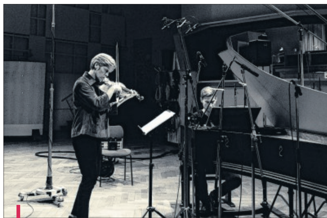
La violoniste Isabelle Faust fait partie des artistes signés sur le label. Elle sera présente au premier festival organisé par Harmonia Mundi qui s'annonce pérenne.

L'accent mis sur les jeunes talents annonce l'avenir du label. Depuis 2017, Harmonia Mundi