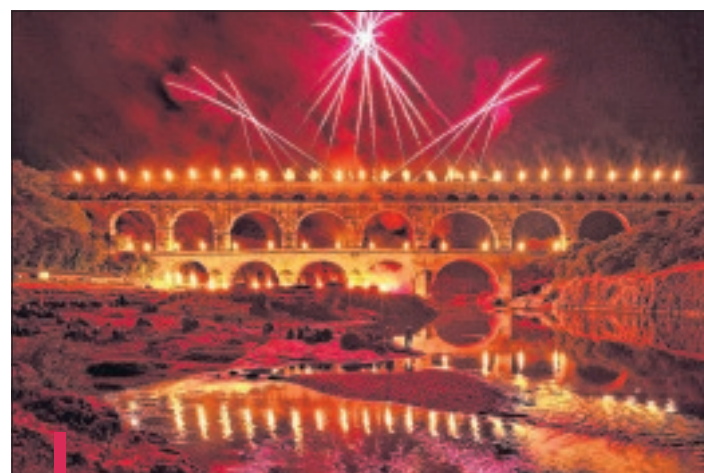
"Feux sacrés" est le dernier volet d'un triptyque qui évoque le Pont du Gard à travers les âges.

Après "Feux gaulois" et "Feux romains", les artistes artificiers proposent un tout nouveau spectacle intitulé "Feux sacrés". Il s'agit du dernier volet d'un triptyque sur l'histoire du Pont du Gard à travers les âges et qui cette fois-ci s'arrête sur de nouvelles périodes emblématiques de l'histoire : le Moyen-Âge et la Renaissance. "Les feux sacrés couvrent la période 500-1500 et mettent l'accent sur l'histoire et le brassage des civilisations au cœur de la Méditerranée. L'expansion de l'islam, les croisades, de la post-romanité à la Renaissance, le travail de fond s'est porté sur toutes les traces culturelles et les mélanges inhérents à de grands